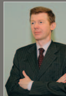
ПРЕДСЕДАТЕЛЕМ ПРЕСС-СЛУЖБЫ РОСБАНКА

Главным источником длинных денег в экономике должна стать эмиссия ЦБ под покупку долгосрочных ценных бумаг Минфина, а не международные рынки