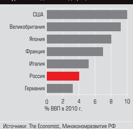
График 2 Большинство стран «большой семерки» существенно опережают Россию по уровню бюджетного дефицита

Эффективное управление бюджетным дефицитом и поддержание его на относительно безрисковом уровне, не более 1,5–2% ВВП, может создать более благоприятные условия для долгосрочных структурных изменений в экономике