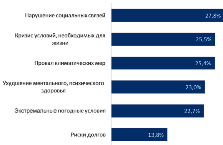
Рисунок 1. Наиболее сильно ухудшившиеся риски в период пандемии (ТОП-6), опрос Всемирного экономического форума